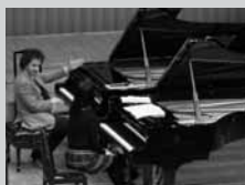
昨年度、大阪音楽大学でのマスタークラスの様子